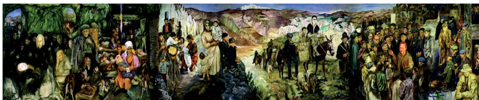
Lucania '61 di Carlo Levi. Matera, Museo Nazionale Palazzo Lanfranchi