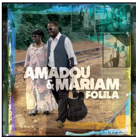
Amadou & Mariam

Amadou & Mariam, entrambi non vedenti e non più giovanissimi, sono una coppia di musicisti africani che ha calcato per decenni solo i palchi dell'Africa occidentale. Poi, grazie ad un album del 2005, "Dimanche à Bamako", la loro musica ha messo il turbo ed è esplosa in tutto il mondo. A Matera, data unica in Italia per il 2015, saranno presenti con una straordinaria band di 10 elementi.