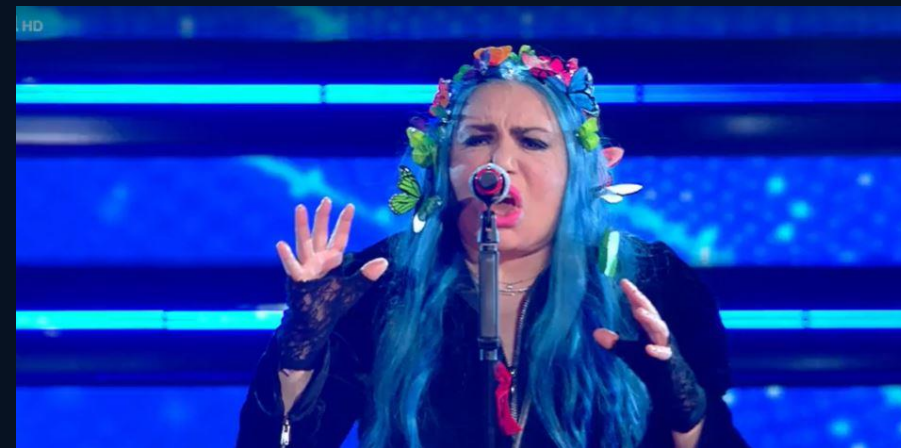
con LOREDANA BERTÈ